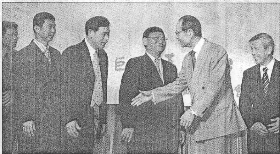
▲昨日返台慶祝會，與歷任中華隊總教練共同合影，右起謝明勇、王貞治、吳祥木、李來發、楊賢銘、郭泰源。