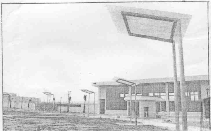
▶楠梓射擊場的定向靶射擊設施。