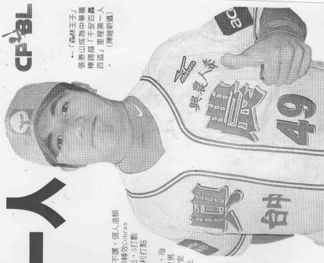
「森林王子」張泰山成爲中華職棒跨越「千安百轟百盜」里程碑第一人。