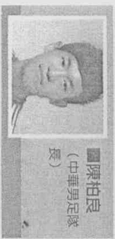
陳柏良 (中華男足隊長)