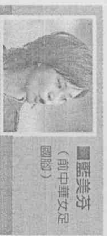
藍美芳 (前中華女足國腳)