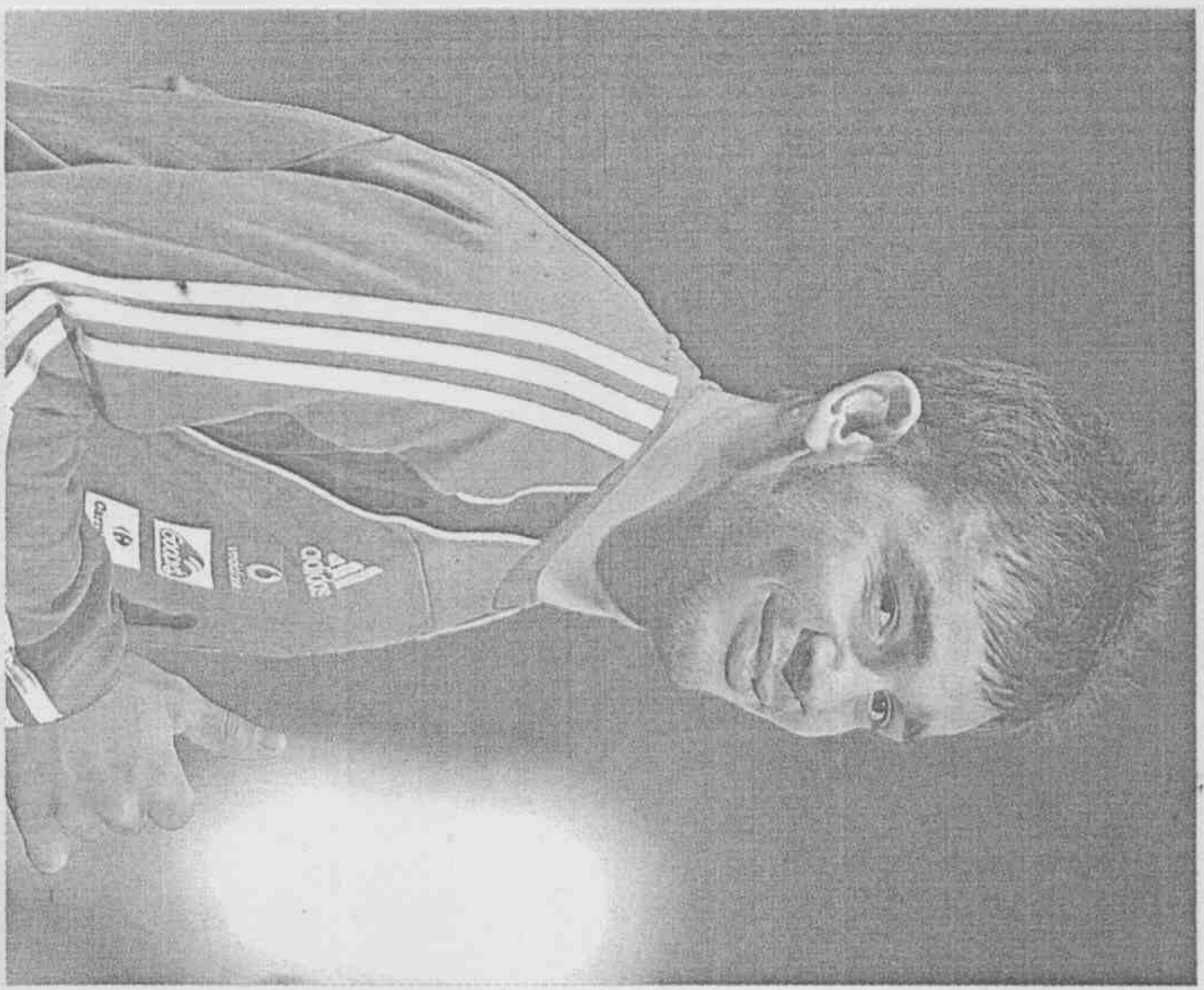
▲希臘隊剛滿20歲的尼尼斯，是國際足總官網上極力推薦的世足賽潛力股新秀。

過無數戰役，經驗豐富。美國隊的國際賽戰績越來越好，包括在去年洲際國家盃冠軍戰只輸給巴西1球(2:3)，加上美國球員體能又棒，所以我認為美國可以逼平英格蘭。