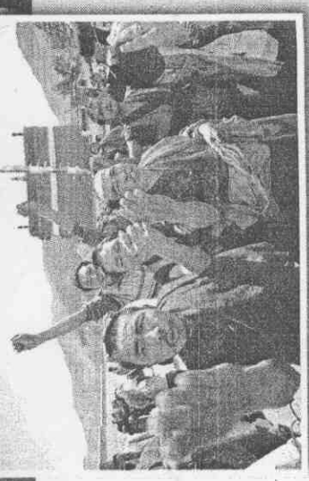
圖：支持西藏的團體與人士八日聚集在舊金山市政廳前，準備杯葛奧運聖火傳遞活動，抗議中國血腥鎮壓西藏。 右圖：中國官方安排外籍記者訪問甘肅拉卜楞寺，卻再度碰上喇嘛不願禁閉寺外，要求外籍記者離開，並高呼口號，要求讓達賴喇嘛返回西藏。