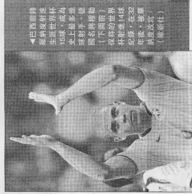
▲巴西前鋒羅納度射進生涯世界杯15球，成為歷史上最多次進球射手。德國名將穆勒(下圖前)保持的世界杯射進14球紀錄，在32年後，被羅納度改寫。

外界批評羅納度的體重過重，穆勒倒是力挺地說，「巴西需要羅納度，沒人在前場的速度比他還快」，「在我心中，他是目前最佳、最完美的前鋒」。穆勒1982年退休，一度染上酒癮，由前拜仁隊友們協助他進行戒酒療程。康復後，擔任拜仁慕尼黑黑業餘隊的助理教練職務，至今仍然在職。