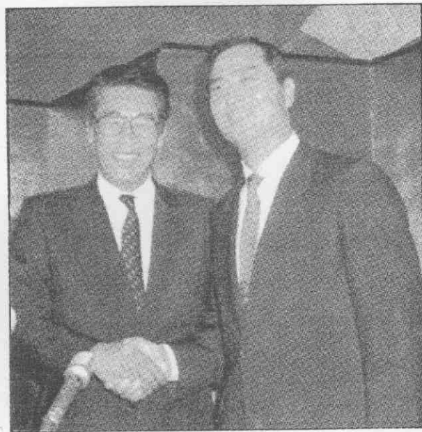
↑王貞治(右)與藤田元司這一握，代表著一個時代的結束，另一個時代的來臨。