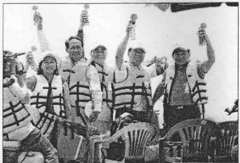
立委廖婉汝（左起）、屏東縣長曹啟鴻、鵬管處長許正雄、立委王進士、縣議員劉水復乘坐快艇，為大鵬灣這項年度水上運動盛會鳴笛起跑。