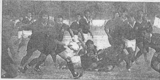
◀區運足球賽高市與高縣球員激烈爭球。