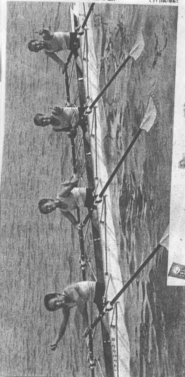
▲我國台北體院女子隊昨日奪得宜蘭盃國際名校划船賽第二名，隊員們比出最棒的手勢。