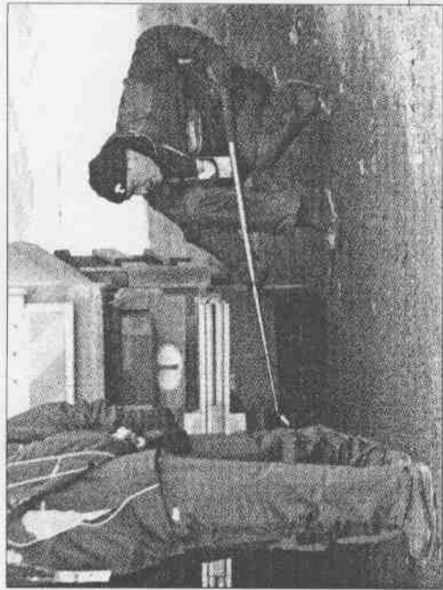
杜林冬運將開幕，運出選手村的汽車，連車底都經過安全檢查才放行。(美聯社) 對參加杜林冬運冰舞比賽的美國代表，在比賽場加緊練習。(美聯社)