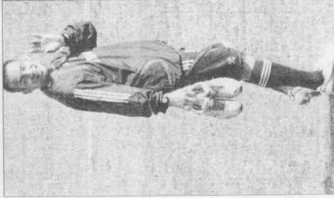
▲ 莎約那拉！日本隊球星中田英壽心昨天宣布將高掛球鞋。

「我希望能夠再次參加世界盃，為巴西隊效力。我們踢得並不壞，而且已經打出了最高水準，被淘汰出局是最令人失望的結局，但討論我們什麼地方好，什麼地方不好，現在還不是時候，我們需要在自己的國家昂著頭兒人。」