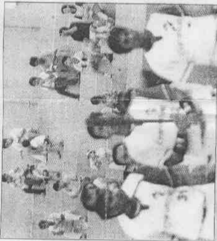
▲受職棒爆發賭案影響，昨晚台中球場象師之戰，觀眾明顯減少。

洪瑞河昨天語重心長的說，既然國人好賭，政府何不開放運動彩券，讓職棒賭博正常化，以避免劣紳人士以收買球員方式，破壞國內職棒環境。