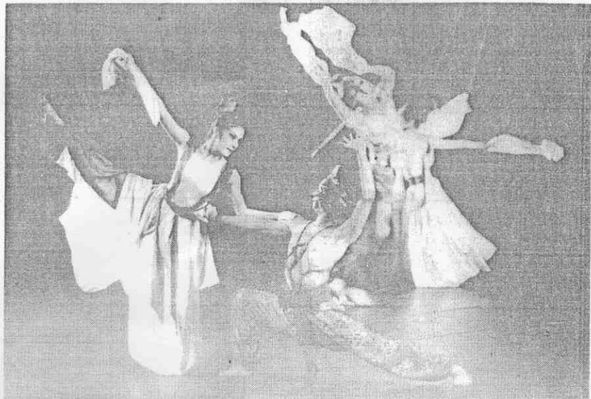
▷國立藝術學院學生重新詮釋「星宿」。 ◁香港演藝學院舞蹈系演出「雲盞教徒」。