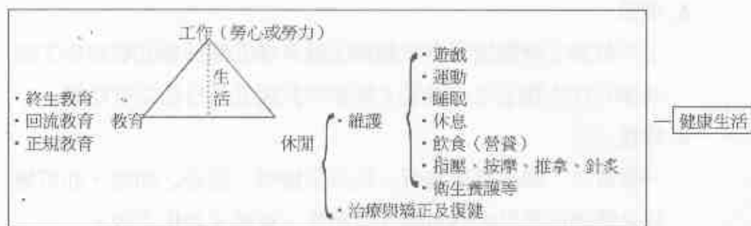
圖二 健康生活的內容