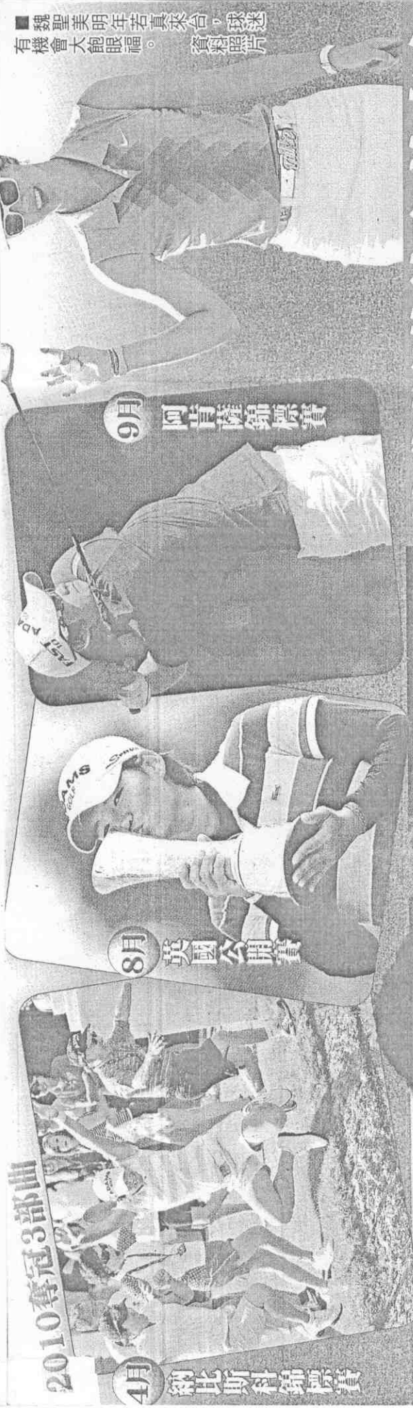
■魏聖美明年若真來台，球迷有機會大飽眼福。 資料照片