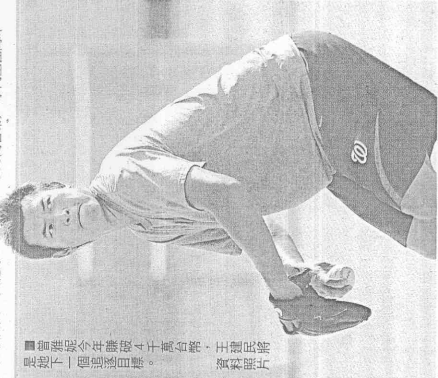
曾雅妮今年賺破4千萬台幣，王建民將是她下一個追逐目標。資料照片

只是職業球員就是看獎金分高下，菜鳥年妮妮平均每場可賺6.4萬美元(約206萬台幣)，去年成績下滑，參賽27場賺129萬美元(約4128萬台幣)，平均每場進帳4.7萬美元，今年靠3座冠軍加持，平均每場可撈9.4萬美元(約300萬台幣)，攀向生涯高峰。