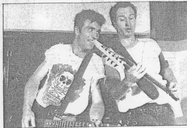
↑「火爆小子」馬克安諾(右)與澳洲網球名將凱西，正合灌一張單曲唱片，所得全部捐作救濟蘇聯亞美尼亞地震的難民。