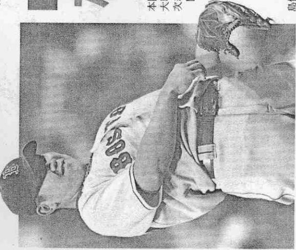
松坂大輔披經典賽最有價值球員綠襪，要挑戰連3季15勝。

2006年首屆經典賽結束，松坂在日職打完季賽後就跟紅襪簽約，而那年剛與水手簽約的城島健司沒參加經典賽，今年經典賽對去年陷入低潮還