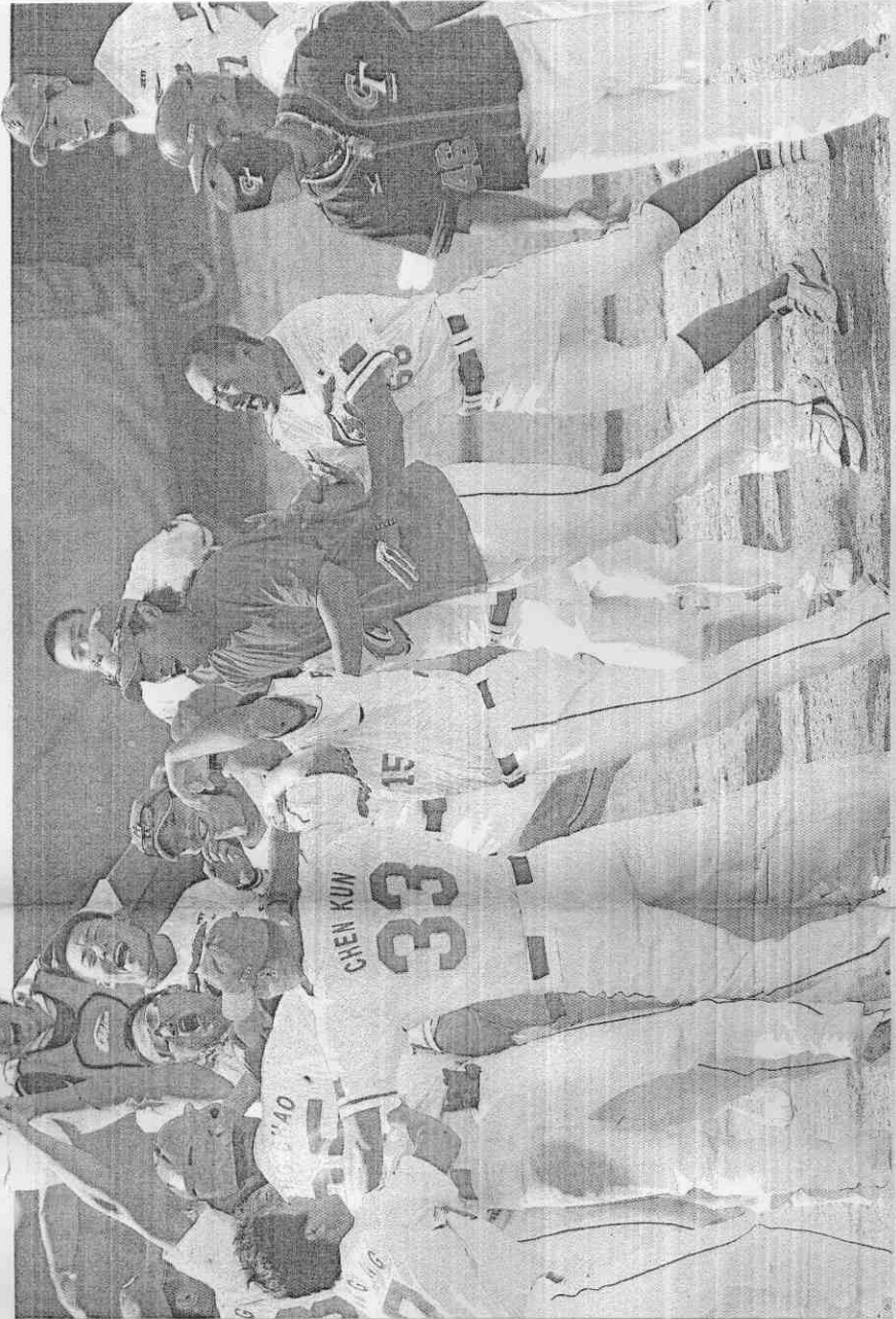
▲中華隊球員冷眼看中國隊慶祝勝利的畫面，希望不要再持續上演。

如果我們還願意把棒球視為國球，從政府、球界、社會民間，大家就應該有一樣的認知、一樣的態度，國球維繫它在台灣應有的尊嚴與高度。