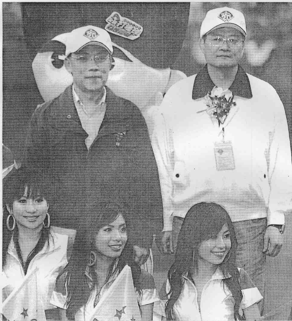
中華職棒開幕戰，法務部法律事務司長張清雲（後排右）、士林地檢署檢察長蔡清祥（後排左）全程坐鎮天母球場。

【記者李祖舜／台北報導】中華職棒今年球季剛開打，法務部已宣示掃蕩假球的決心。立委趙麗雲透露，前天中職首場賽事，法務部長王清峰指派法律事務司長張清雲、士林地檢署檢察長蔡清祥全程坐鎮天母球場，也將指派專屬檢察官進駐各地球場，嚴防「假、賭、黑」事件。 趙麗雲說，上周五她在總統府時，向法務部質詢中華職棒聯盟開打後的反制假球行動案，王清峰承諾全力防堵「假、賭、黑」行動，隨後在周六的職棒開幕日，就指派張清雲與球場所在地的士林地檢署檢察長蔡清祥全程坐鎮球場，讓在場觀賽的她相當感動。 趙麗雲透露，王清峰向她表示，未來中職在北中南各地賽球時，當地檢察署將會指派專責檢察官進場「盯場」，並在當地警局協助下，掌握球賽狀況。 立法院教育委員會今天將審查行政院版與立委版的「運動彩券發行條例」草案，提出立法版本的趙麗雲指出，運彩職棒開賭銷售不佳，主要是因為運彩彩金分配比例，是與公益彩券相同的百分之七十五，與地下賭盤的百分之九十五有相當大的差距，再加上運彩銷售單位為防假球詐賭，所以採取較為繁複的賭法，民衆不易上手。 中職加入運動彩券賭盤開賣後銷售狀況不佳，趙麗雲表示目前只能儘速讓運彩條例完成立法，等運作上軌道，取得公益彩券經銷商的認同後，再視狀況逐步調高彩金分配比例。