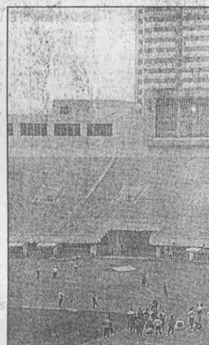
↑在西安市中心黃金地段朱雀廣場，五萬人體育場上，田徑隊在訓練，後頭兩棟摩天樓，也是體育場附屬商業及住宿樓。