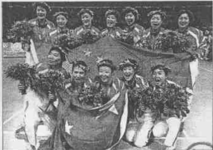
◆俄羅斯(白球衣)在排球決賽先聲後振，橫掃金牌也喪失超越大陸的機會。 會大陸女排贏得第31金之後，確保在雅典奧運老二的地位。