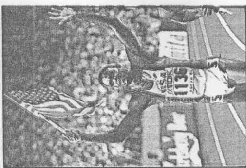
↑劉易士在東京世界田徑賽刷新100公尺世界紀錄後，高興地拿著美國國旗繞場。

包威爾突破貝蒙障礙居次 南非重返國際體壇佔2席 編譯 林滄陳 / 綜合外電報導 ●美國田徑名將劉易士，在美聯社1991年世界體壇20件大事票選活動中，以改寫男子百公尺世界紀錄的優異表現，榮登榜首。美聯社是邀請歐洲、亞洲、非