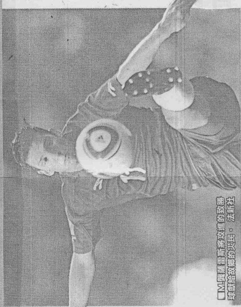
智利羅薩雷斯將攻進的致勝球獻給故鄉的災民。