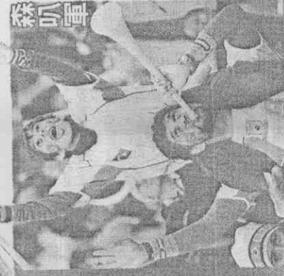
■巴西29歲前鋒法比亞諾(前)終於展現冠軍衫軍的進攻火力。