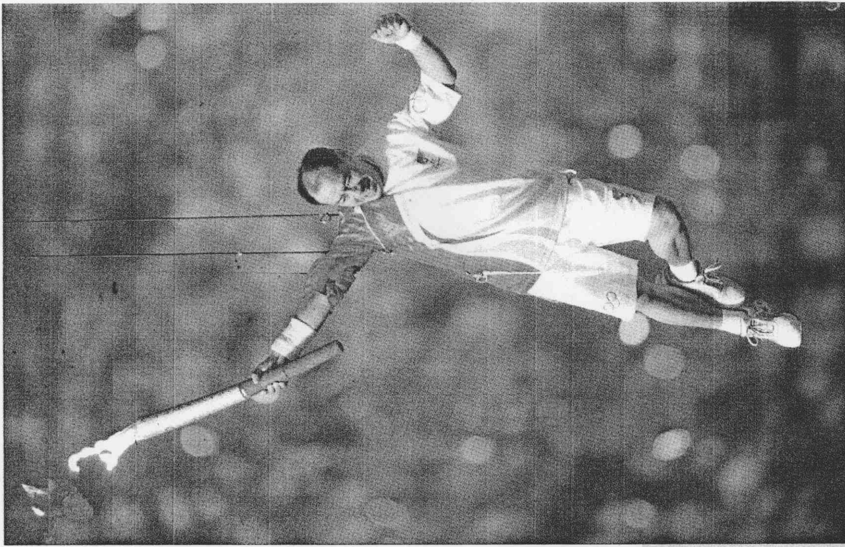
↑前大陸「體操王子」李寧八日「飛向」鳥巢的聖火台，成功點燃聖火。（新華社） ↓奧運開幕式中，演員身上閃著LED燈，在卷軸上組成一隻和平鴿。（新華社）

【特派記者陳東旭／北京報導】前晚奧運開幕式在空中繞場，仿若有無比輕功，最後點燃聖火掀起高潮的大陸「體操王子」李寧，結束後鬆了一口氣透露，在空中時風太大，聖火差點滅了，他趕緊轉個角度，才保住聖火不滅；萬一聖火在最後熄滅，李寧說「我豈不成了千古罪人。」 李寧舉著火炬，飛向天空，邁著太空步，在鳥巢邊緣繞場一周，最後高舉火炬點燃京奧主火炬。李寧飛天的秘密，主要是綁在身上的鋼絲。 即便當年身輕如燕，打空翻如斬切菜，但現年四十五歲的李寧身材發福，動作不比當年靈活。為了達成點火任務，他是足足練了一個月，包括香港著名武術指導程小東在內的專家組，指導他進行訓練。 李寧飛天點火，用鋼絲綁住腰部吊起來，然後在半空中做跑步的運作，整個過程長達三分鐘。李寧說，空中跑步時，完全沒有著力點，他要用腰力做動作，還要看起來流暢，相當吃力。練習一個月來，他每次被吊到半空練，練完後，差點站也站不住。八月初彩排時，李寧被吊到接近鳥巢頂部、超過六十公尺的高度練習。 北京奧組委為何找李寧點聖火，不找現役運動員？開幕式總導演張藝謀說：「現役運動員怕受傷；此外，希望找一位會獲得最崇高榮譽的退役運動員，而且必須有體操和技能的基礎。經過國家體育總局推薦，最後選擇李寧。」 張藝謀說，在空中做一週全套動作，要經過五百公尺、歷時三分零十秒，一般需要休息一小時，才能做第二次；「有時我們都下班了，在空中看到一個小小的身影，就是他（李寧）一個人在那練習。」 臨近奧運開幕，李寧每天都是凌晨一兩點到鳥巢練習。為了保密，他連妻子也瞞住，只說參加開幕式表演。