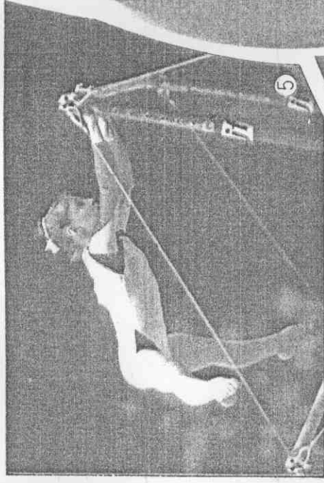
·作動手拿展示上槓低高和馬跳在，絲瓦里西亞尼亞馬羅的分滿個兩拿連⑤④ ·響影受大績成，賽出傷帶里布杜「精妖小」亞尼馬羅⑥ (「影攝運全」用採家獨報本) ·翻手前的上木衡的國美⑦