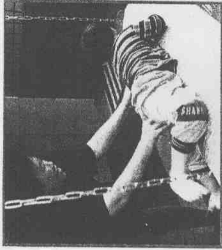
↑感覺統合訓練可改善發展遲緩兒的問題。