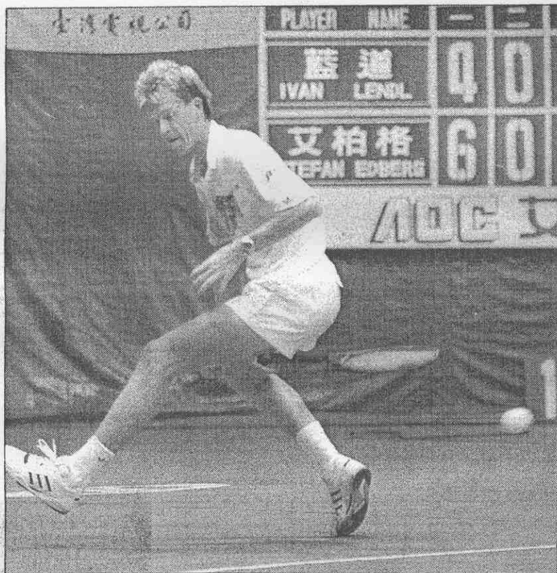
← 贏了第一盤，艾柏格開始放心作秀，再三胯下擊球，有一次還成功過網。