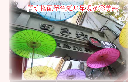
田子坊隨處可見專業剪紙藝術

首到之處「田子坊」的石門老建築、創意市集，讓人嗅到了上海的人文氣息。夜遊黃浦江時，才真正感受到上海市的經濟發展是多麼的健壯，兩岸除了座落指標性建築東方明珠塔，陸家嘴金融貿易區中鑲著閃爍霓虹燈的高樓大廈，一幢幢不爭相衝入雲端，也算是第一次看到的世界之大，到了外灘便也見證了昔日的十里洋場。