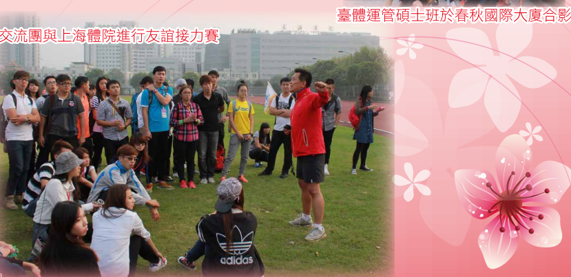
交流團與上海體院進行友誼接力賽