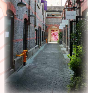
新天地可感受歐式街區的異國風情

搭乘觀光巴士遊覽上海市時，除可瞥見市民白天的生活情況，到了外灘也再次感受到何謂萬國建築博覽的盛況，當然最知名的非「和平飯店」莫屬了。雖然在新天地駐足的時間不長，那佈滿石磚的街道卻讓人誤以為置身歐洲，充滿了異國風情。