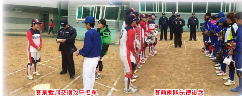
賽前裁判交換攻守名單

女壘隊原訂暑假期間赴韓國參加「2014第十一屆韓國順天國際女子壘球邀請賽」，因MARS延後至11月23至29日舉辦。本屆參賽隊伍計有日本大阪青山大學、韓國尚智大學、韓國江南社會隊以及本校參賽。其中日本隊已連續七年都參與盛會，本校為第五次參加。