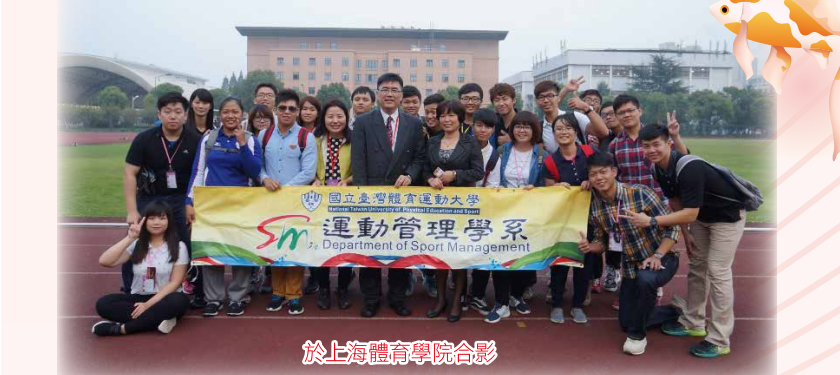
於上海體育學院合影

隔天的「上海旅遊高等專科學校」，讓我看到了他們對學生的栽培與用心，一條條的課程，把整個五星級的飯店搬進學校，提供學生實務的上課與參與其中的感覺。下午到了，這趟旅程當中，我最期待的「上海體育學院」，雖然說是學院，但是他們學校的佔地是臺體大的好幾倍，專業的場地，提供學生最好的訓練，難怪孕育出那麼多的奧運金牌。晚上的「夜遊黃浦江」，放眼望過去，記憶在眼裡與腦海裡的景色，我想…這輩子是忘不了的一條黃浦江，兩種不一樣的景色，見證了上海，百年前後的歷史，也看出了上海飛快進步與經濟的成長，我相信，事隔一年後我再踏上，上海這個城市，它們會不一樣，會有更繁榮的改變。