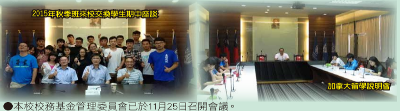
2015年秋季班來校交換學生期中座談