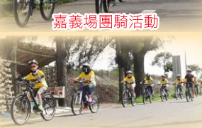
朴子溪自行車道(東石段)