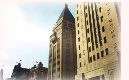
和平飯店，周潤發主演以此為名之電影

最令人感到興奮的，莫過於第4天親臨的「東方明珠」與「中華藝術宮」。雖然廣播電視塔高度和臺灣的101相去不遠，建築構思卻是更加特殊，此處重點在於263公尺高的360度環狀觀景廊，雖然腳踩的透明玻璃總讓人忐忑，但眼望中國各省處的遠方就無所畏懼了，大夥反倒起了玩興，挑戰利用各種姿勢在透明玻璃上留影，有趣極了！