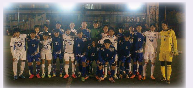
夜間比賽後與桐蔭橫濱大學隊合影