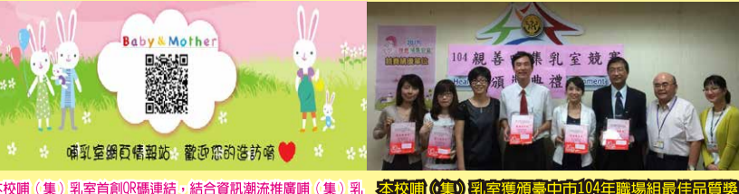
本校(集)乳室自創QR碼連結，結合資訊網路推廣(集)乳室