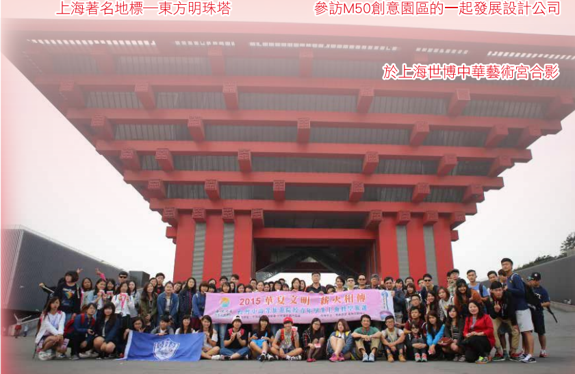
於上海世博中華藝術宮合影

「世界那麼大，我想去看看。」曾經一封任性而為的辭職信，在今年初被網友披露並經媒體報導後，受到廣泛的討論，不管正反兩面意見如何，這簡短的十個字卻對從未踏出國門的我起了具足作用，我還真想看看這世界到底有多大。