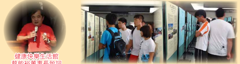
學生實習成果吸引與會嘉賓瀏覽