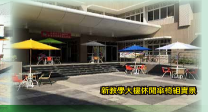
行政教學大樓休閒座椅組實景