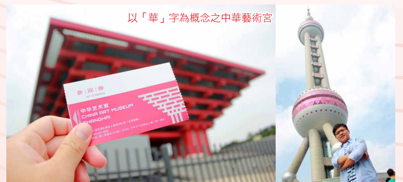
以「華」字為概念之中華藝術宮

到了中華藝術宮，那外觀除了顏色是中國人所愛的紅，四面呆板的方柱架構上寬下窄穿插著，其實是展現的是繁體字「華」的概念，設計者的巧思著實讓人佩服。人稱江南的一大特色肯定是流水、拱橋與中國建築等元素所結合的美麗景色，而最後一天的旅遊行程也在水都「七寶古鎮」中體驗到這樣的風情，並畫下此行的完美句點。