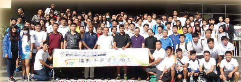
學生實務與實習成果展合影