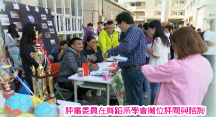
評審委員在舞蹈系學會暨社團評鑑與諮詢