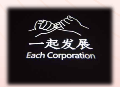
參訪M50創意園區的一起發展設計公司