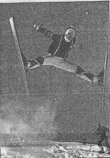
↑世界蒙古式花式滑雪冠軍葛洛斯皮隆，他是在自由式滑雪比賽場提涅與亞爾克最有希望奪魁者。→選手在超大曲道賽準備衝出下滑的剎那。

阿爾卑斯式滑雪的混合式是由1個滑降和2個小曲道結合而成，滑完這3項時間最短的選手獲勝，它要求滑降的技巧、速度及急轉彎的純熟動作兼顧。