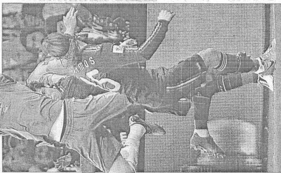
▲西班牙隊長卡西亞斯把關能力一流，他躍起在空中搶先抓下球，攔阻荷蘭攻勢。

門神卡西亞斯兩度撲下險球 伊涅斯塔在延長賽第116分鐘絕殺荷蘭 西班牙全國狂歡慶功