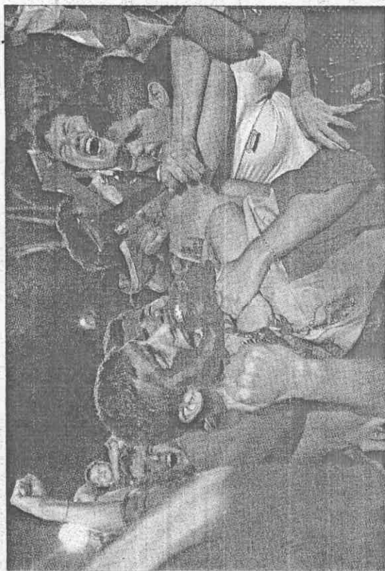
▲在馬德里市區廣場中觀戰的球迷，目睹西隊進球後興奮的拉扯吼叫。