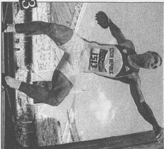
記者 蕭柏安／綜合報導

兩天比賽中，所有參賽者都保持最佳體能，在10個不同項目中爭取分數。田徑場上男子10項全能難度不言而喻，但對捷克的塞布勒而言，這是他生平最快樂的兩天。