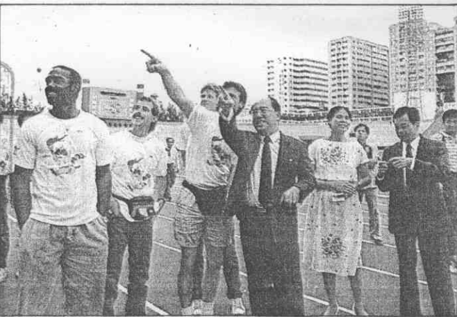
的「觀參被」了成，場育體北台觀參星明徑田國外 ↑ 。