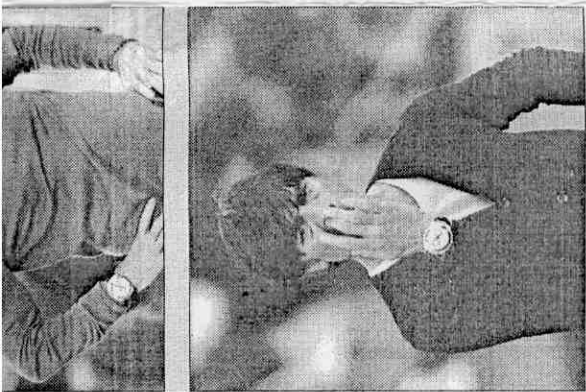
勒夫微笑迷人，氣質獨特，衣著有品味。就算當挖鼻，女粉絲還是很哈他。

...子，一 ...且更危 ...比一輸 ...隊一直在 ...們領先 ...比亞 ...任任務 ...進決賽 ...年才踢 ...然不想 ...能不能 ...可以 ...為球隊 ...。... ...國闖入 ...多達十二 ...，本屆 ...克」得 ...。... ...小，「我 ...有五支 ...隊回家 ...是德國 ...一直在創 ...之一。 ...國隊八 ...任世界杯 ...和保持