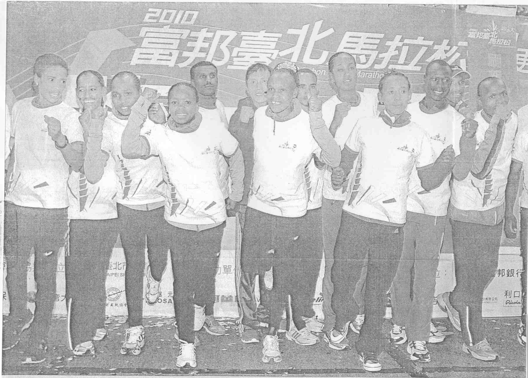
蓄勢待發 準備出「馬」

▲2010富邦臺北馬拉松選手歡迎茶會暨記者會17日舉行，來自國外的參賽選手一同出席記者會，表達必勝的決心。