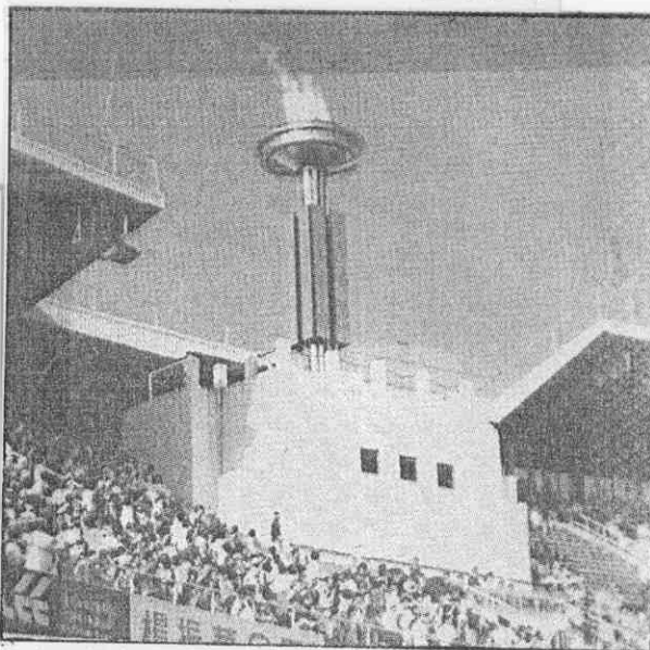
↑亞運會聖火在預演中燃起。

科威特有5個項目七十多位選手目前在沙烏地集訓，小法哈德表示科威特參加亞運勢在必行，沙烏地代表團在日內將抵達北京，科威特可能在17日抵達。