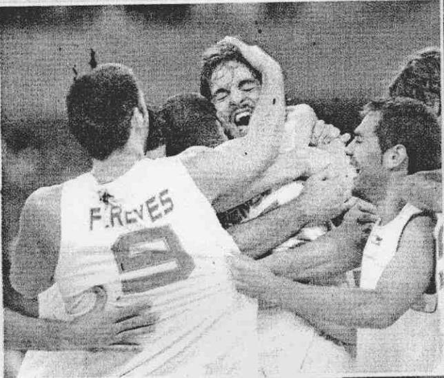
得到35分，鬥牛士軍團就此奠定勝基，終場以91：86重溫1984年後首次金牌戰滋味，當年西班牙男籃僅獲奧運銀牌，立陶宛則連續第5屆落入銅牌戰。美國與西班牙，將於明日爭金牌。

4強賽另一對戰組合，西班牙與立陶宛殺到最後一刻才分出高下，立陶宛全場轟進12記三分彈，不過西班牙禁區攻勢猛烈，並以44次罰球機會輕鬆