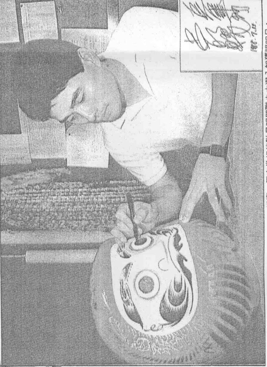
▲採應，與高當相後隊星明盟聯央選入知獲賜明呂。喜歡示以，睛點上翁倒不摩蓬物祥吉在求要的者記訪。

安打，在守備上也頻頻出現失誤，讓大洋隊予取予求。另外，巨人隊在第一局上半的一次盜壘戰術令人不敢苟同。另外，中日隊的郭源治繼昨天之後，今天再度救援成功，使中日隊以四比二戰勝阪神隊。這是中日隊六連敗之後的連續第六場勝利，與首位廣島隊之間的勝差縮小為一。〇，將是爭取冠軍的一支勁旅。