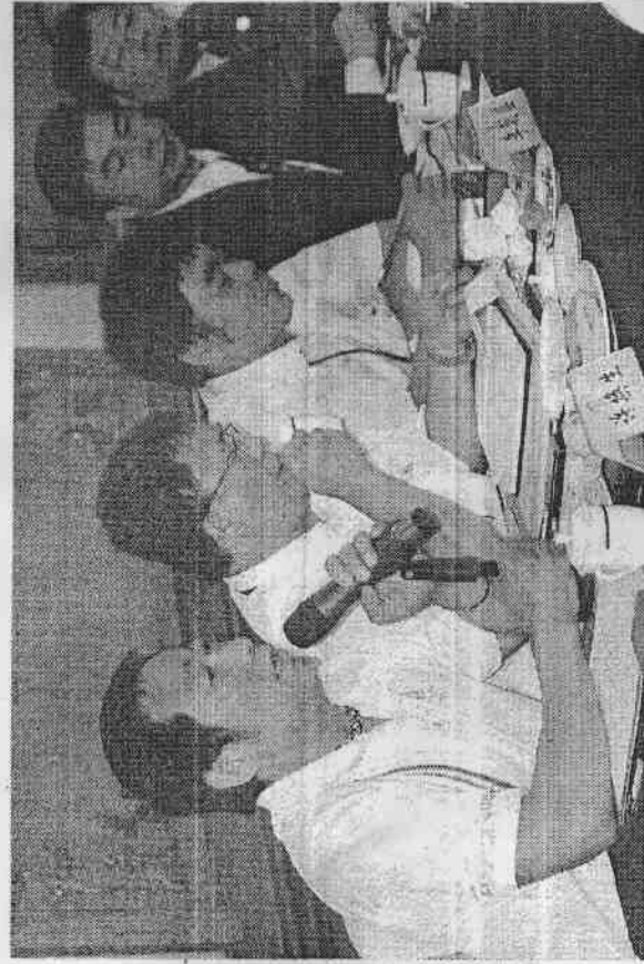
金門縣長李炷烽特別派體育場長許煥生前來廈門，參加海峽論壇體育交流座談會，並安排三大賽會與金廈長泳活動，約請兩岸體育界人士共襄盛舉。