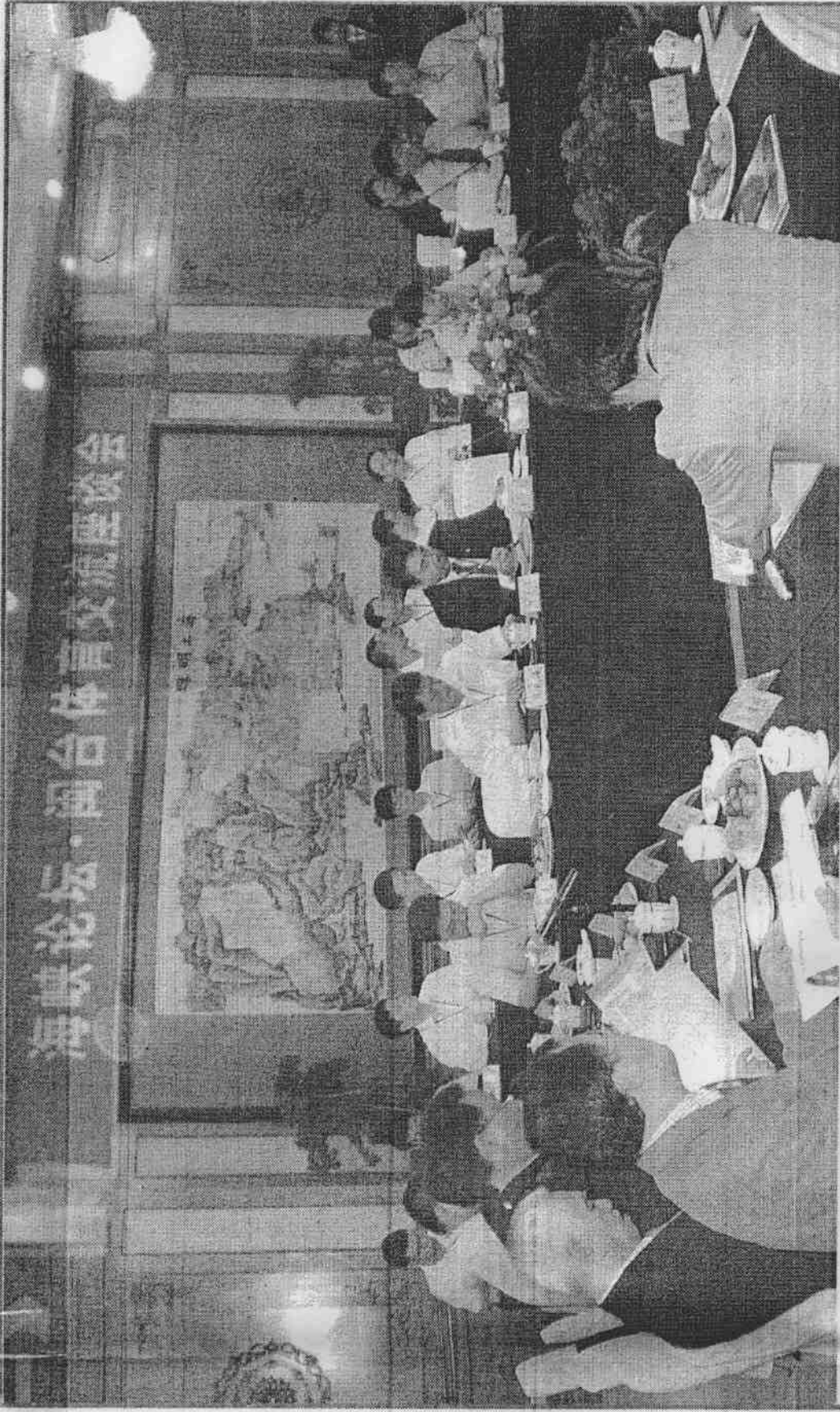
海峽論壇的體育交流座談會，昨天在廈門賓館舉行。