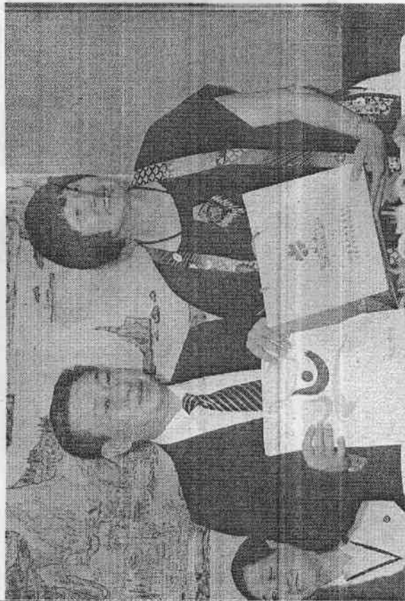
聞名中外的田徑女傑紀政，昨天代表台北市將今年九月郝龍斌市長主辦的聽障奧運會資料與訊息送給福建和大陸的體育界同好，由福建省體育總會副主席楊文科代表接受。