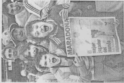
阿根廷球迷興奮地拿著傳奇球星馬拉度納的球衣或球衣加印。

人為幫助國團門擊敗阿根廷，不惜找巫師用動物鮮血作法，寄望讓梅西威力盡失，報導看來煞有其事，開賽不到5分鐘，阿根廷卻兩度兵臨城下，其中一次就是梅西起腳。