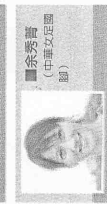
■余秀堯 (中華女足國腳)