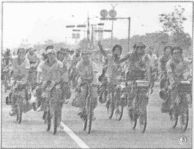
(攝明壽楊)。北台歸凱舉壯成完③。獎受士騎的異優現表②。中途在地發煥姿英者勇的上板踏①