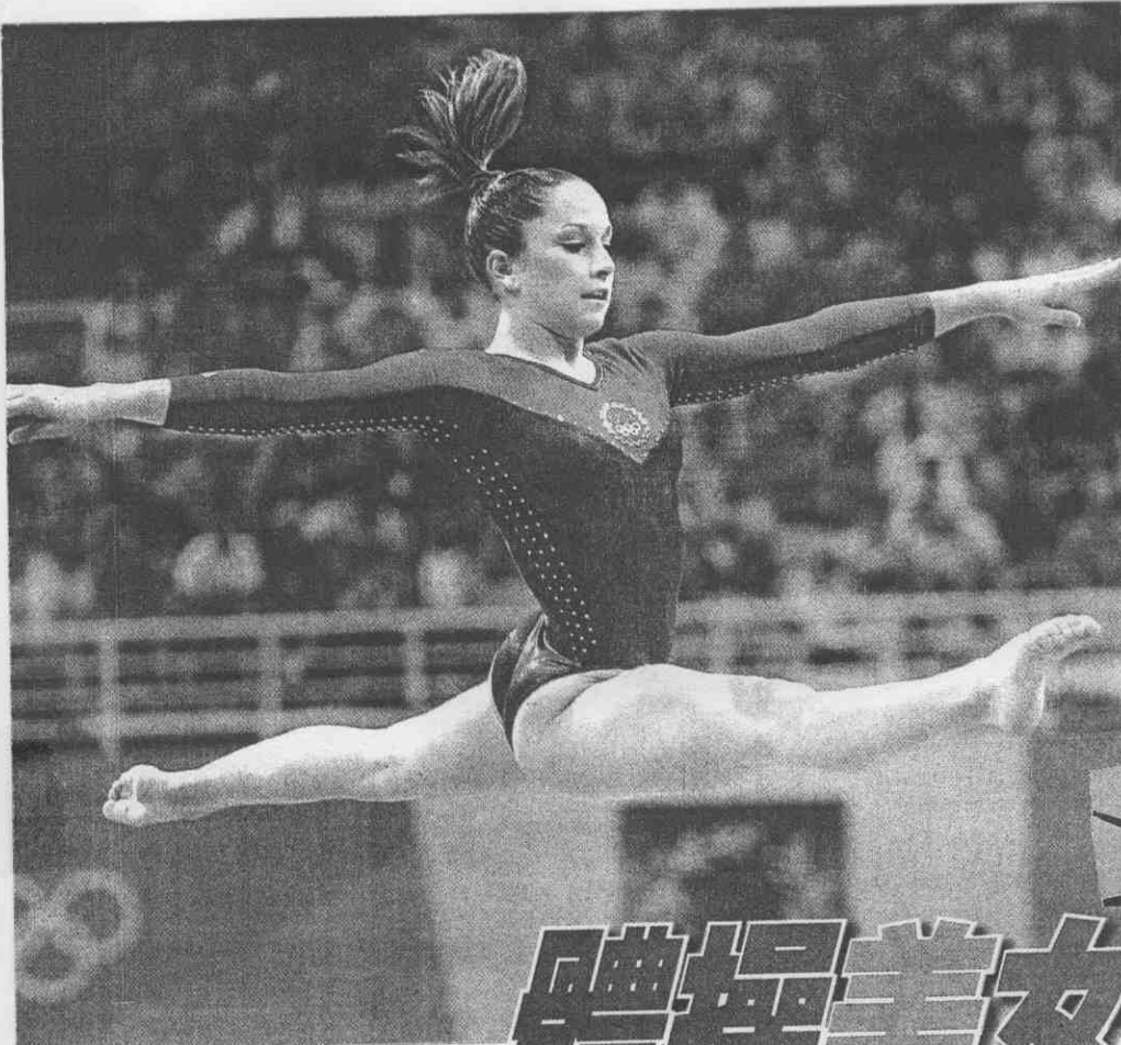
◀首次參賽就奪金！美國16歲體操選手帕特森在地板項目精湛演出，她在此項獲得9.712全場最高分。