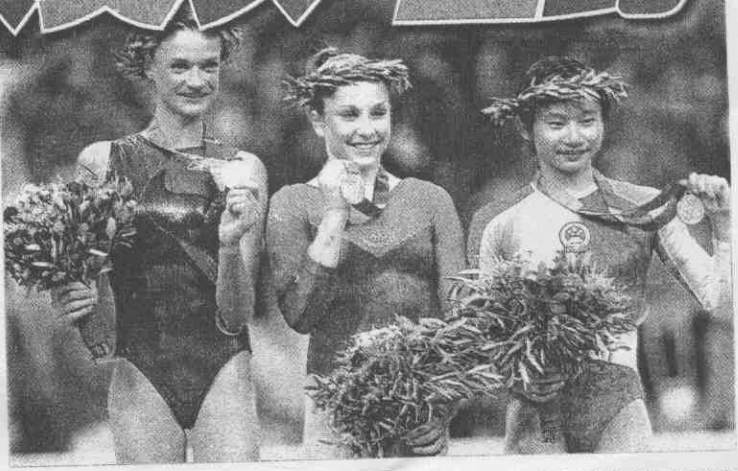
▲美國小將帕特森（中）奧運女子體操個人全能項目擊敗俄羅斯強敵霍金娜（左）奪下金牌，右為得到銅牌的中國選手張楠。