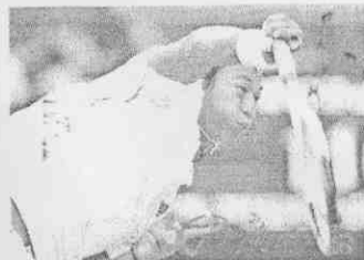
彥勳打造了一個家庭球隊，讓家庭為自己撑起了一片「天」

報10月6日報導(記者孫嘉輝)他很生猛，今年溫網公開賽男單第5強，他復出，連小S在節目中也要向他「勾肩搭背」，能夠獲選出席中網公開賽抽籤儀式并抽到好籤，是因為「阿球一哥」、中華台北名將盧彥勳。出于對本報的青睞，加中網公開賽的首次獨家專訪交給本報記者完成，并簽訂鎖定年終收自戰的男單金牌。