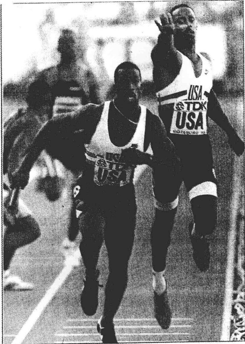
↑美國名將麥克強森在千六接力決賽(左)接棒起跑，最後終於掙得個人第三面金牌。