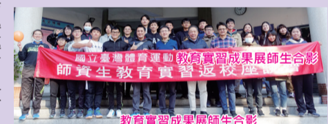
教育實習成果展師生合影