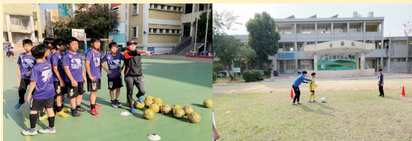
女足隊各選手下鄉教學的狀態

今年寒假除了訓練之外，也安排了下鄉教學，回饋自己的家鄉與母校，並把選手所學的資訊與踢球經驗帶回母校指導學弟妹，並且增進教學經驗，關心基層的教學狀況與困難，並與母校教練交流與連結，也了解每個學校的選手狀態，也能夠在畢業後擁有很多的教學經歷，儘快適應教練的身分與選手的狀況或學校，也藉下鄉教學更了解目前選手分布情形，並進行記錄與招募。