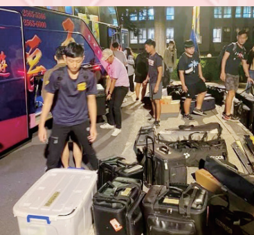
運傳系學生晚上抵達高師大體育館，開始卸器材

對於大多數的觀眾來說，這或許僅是他們欣賞無數比賽中非常不起眼的其中一場，可是，對我們來說這卻是難得的實習機會，更是為我們的大學生活增添幾分色彩。