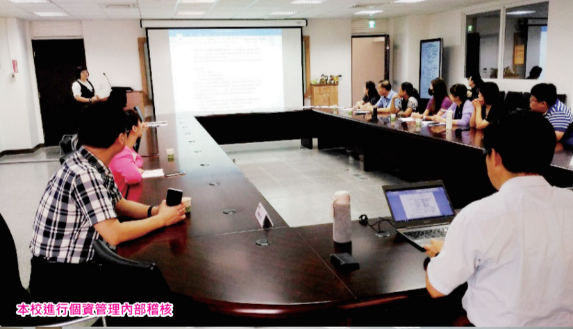
本校進行個人資料管理內部稽核

行政院於109年9月9日公告施行新(2019年)版教育體系資通安全暨個人資料管理規範後，本校於1月20日至21日接受驗證中心進行外部稽核，驗證單位全部通過稽核，經外部稽核委員認可，建議驗證中心發證。