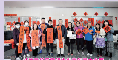
林中華校長與師生歡慶新年合影