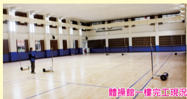
體操館一樓完成現況