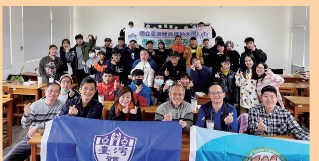
運動教育學院109-1境外生聯誼活動暨師生座談會