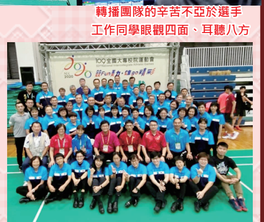
轉播團隊的辛苦不亞於選手工作同學眼觀四面、耳聽八方