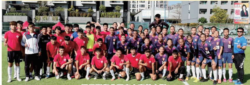
男足隊與北門高中賽前合影

這次大專足球聯賽我們男足也如期順利的進入複賽，當然也是我們所預期的，預賽的大家的表現還算不錯，所以在複賽的排序對我們是有很大的幫助。寒假期間我們也不敢怠惰，還是很積極的備戰這次的大專盃足球聯賽，寒假除了訓練之外，也安排了幾場對抗賽，與北門高中、惠文高中進行幾場的練習賽，一方面可以透過比賽了解目前球員的狀況，來進行修正，讓不管是個人、小組、整體的狀態達到最佳，一方面也可以藉由對抗賽與高中選手進行交流認識，讓高中學生更了解本校，也能促進彼此關係、對爾後不管是招生、交流賽事等，都有很大的幫助。