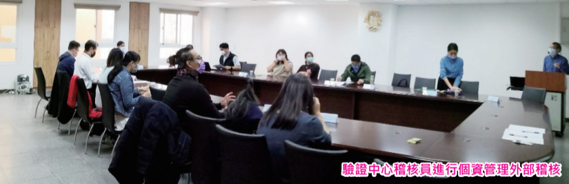
驗證中心稽核員進行個人資料管理外部稽核