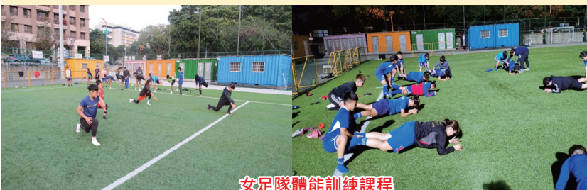
女足隊體能訓練課程

經過大專盃第一、二循環比賽之後，觀察到每個選手的身體素質與比賽中的抗衡與衝撞狀態不太好，希望藉由體能教練的課程與調整，讓選手理解在運動中如何使用力量與抗衡，也藉由體能訓練加強選手核心肌群，能夠運用在比賽中，發揮最好的運動表現。