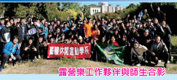
露營營工作夥伴與師生合影