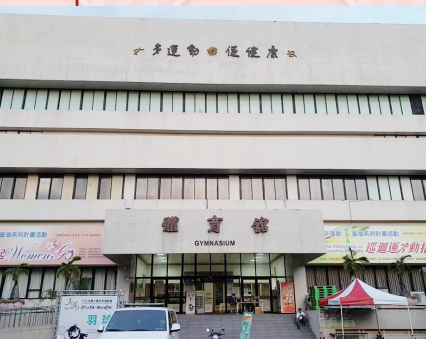
109大運會羽球比賽場館-高師大體育館