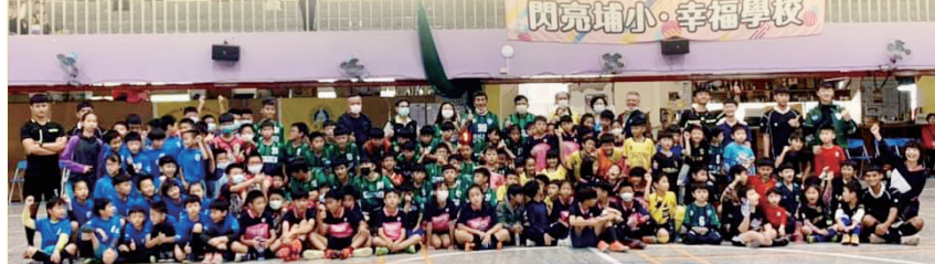
埔里國小足球推展教學賽前合影

當然複賽期望目標就是進入四強賽，除了進入四強外還要能夠選擇四強賽隊伍，這樣對我們進入冠軍賽的目標就會更大，所以複賽的每一場都是關鍵，不管面對的隊伍實力如何，我們都要戰戰兢兢的打好接下來的每一場賽事，一直到達到目標，近期雖然有部分的選手受到傷勢的困擾，在訓練的氛圍、態度、積極度都是高昂的，教練也期望學生能堅持到最後，打好成績，將目標拿下。