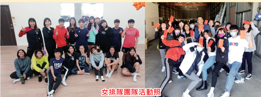
女排隊團隊活動照

今年寒假女排球員們因應大專盃複賽的臨近，所以春節連假只從小年夜放到初三，短短的五天假期期間，球員們把握和家人團圓遊玩的時間，好好休息，養精蓄銳。初四收假後，雖然大家的心依舊依依不捨，但整理好心情來到球場，換好球衣、繫好球鞋後，就開始和隊友一同訓練。寒假是每隊為大專盃衝刺的時刻，當然我們也不例外，花了比別人多很多的時間做戰術上的搭配和體能上的調節，這些都是老師希望能在比賽時女孩們能夠用到，疲乏的訓練套餐也會讓女孩們感到厭倦消極，因此老師也會安排一些團隊活動讓女孩們暫時拋開賽季帶來的壓力，也能增進團隊的和諧性和激勵團隊。