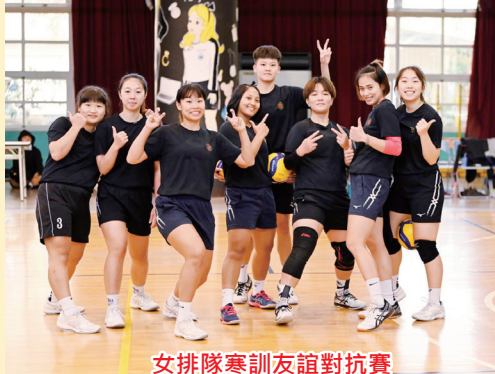
女排隊寒訓友誼對抗賽

這次大專盃複賽將在明志科大舉行，從預賽回來後就開始為個人和團隊隊型加強調整的女孩們，對於球技方面都是相當有信心的，至於心態方面，也希望女孩們不要想太多，能收拾好心情和壓力，調整好自我，和隊友們迎戰接下來的重重挑戰。