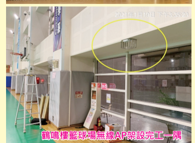
鶴鳴樓無線網路LAP設備安裝工程一隅