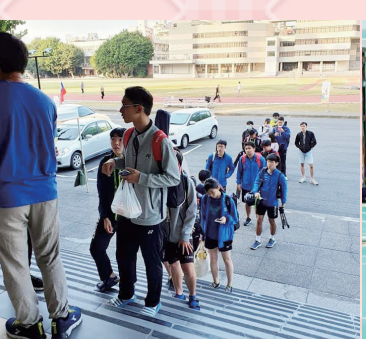
不論選手、教練入場都要量體溫