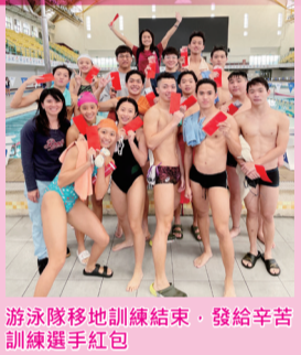
游泳隊移地訓練結束，發給辛苦訓練選手紅包