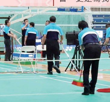
裁判進行賽前場地整理