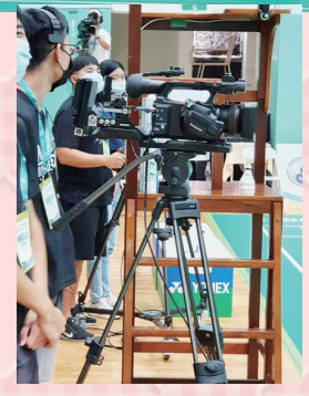
7部攝影機的專業羽球轉播