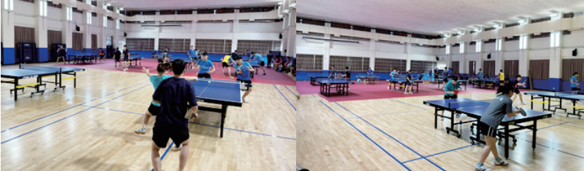
桌球隊和美實驗學校友誼賽

去年大專盃因疫情延期，選手們在寒假的訓練上做了很多調整，著重於單項技術個人化訓練的加強，也加強了體能的訓練，提高整體選手身體素質。在內部的自我訓練以外，也與其他優秀國中相互交流與學習(以賽代訓)，1月26日和美實驗學校、2月2日南投國中來校進行友誼賽，相互交流學習，除此之外，也固定禮拜三到羽球場重訓室做重訓，增加選手的整體身體素質。