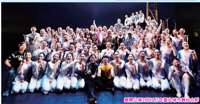
舞團公演3月21日在臺北城市舞台合影