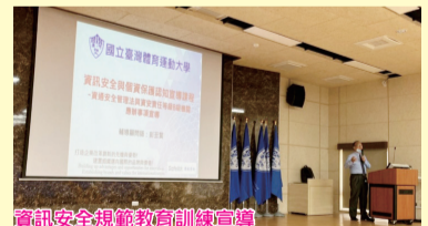
資訊安全連線教育訓練會場