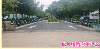
聯外道路完成現況