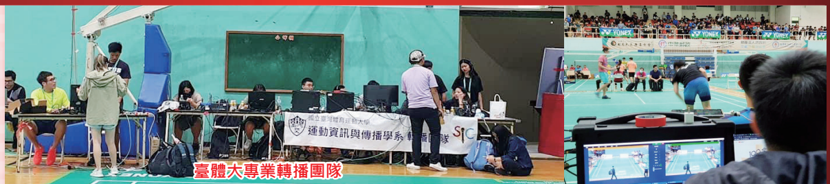
臺體大專業轉播團隊

我的工作就是訓練這群享受不到掌聲的運動人，畢業後能有一份有尊嚴的工作，一屆又一屆。大運會，咱們明年臺南見囉！