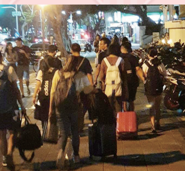
拖著疲憊的步伐，學生帶著器材回住處