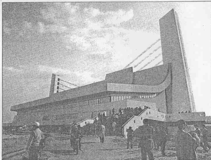
↑這是游泳館，游泳、跳水都在這裏舉行。