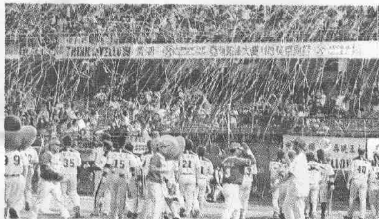
象隊昨晚在新莊打完本季最後一戰，雖與季後賽無緣，象迷仍拋下黃色絲帶，慶祝今年打進A級球隊。

前天獅隊無緣在高雄痛飲香檳，似乎就成為獅隊的「凶兆」，而且熊隊去年就是在台南奪下總冠軍，昨天再度向獅隊說聲：「對不起！」也讓獅隊的「台南魔咒」得繼續延續下去。