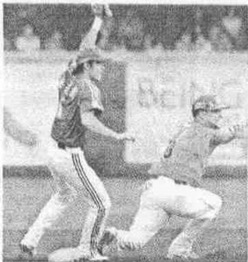
一局下布雷揮出安打後盜壘失敗，獅反攻受挫。

【記者鄭又嘉/台南報導】台南是統一最溫暖的家，卻也是最令他們心碎的地方，2000年以後共有4次在台南封王的紀錄，4次都跟他們有關，但真正順利拋下彩帶，竟然只有1次。