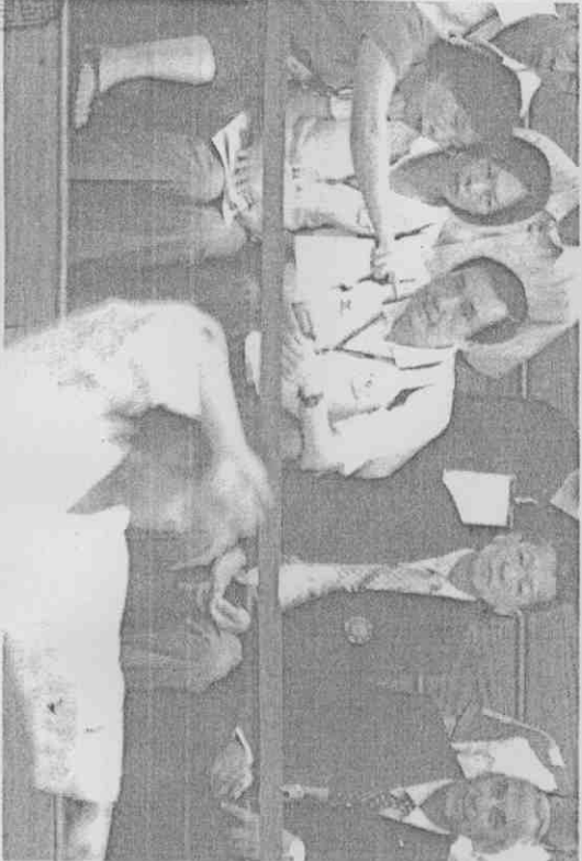
馬英九總統上午投完黨主席選舉票後，立刻南下高雄觀看世運空手道項目比賽。