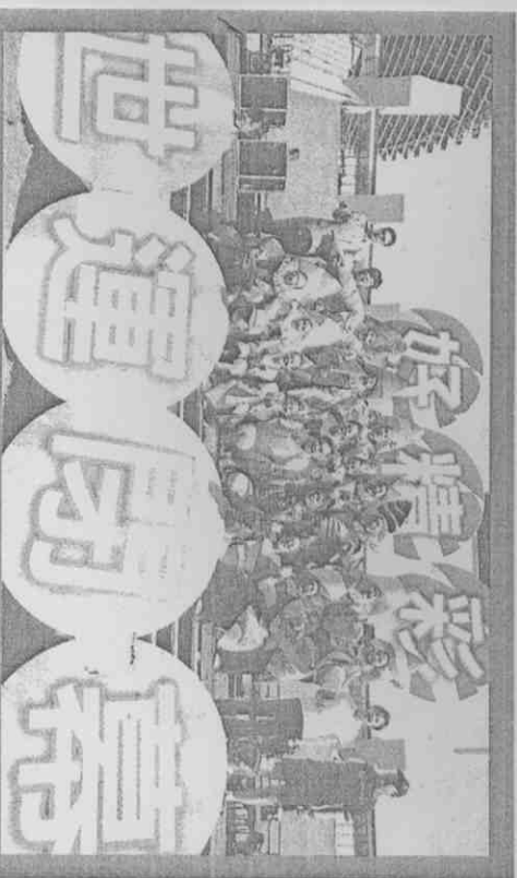
進行了11天的高雄世運今天閉幕，昨天主場館試放「彩色煙火」，預告觀眾將有新的視覺享受。

化，長約45分鐘，包括流行音樂和古典樂曲的組曲演奏，搭配大型投影，高雄在地表演團體包括美舞團、城市芭蕾舞團、三信家商舞蹈團、巴洛克獨奏家樂團、高雄室內合唱團等，將先後演出；藝人表演則有開關合唱團、呂超倫、郭星好等。