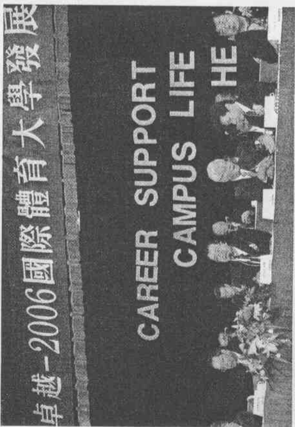
↑圓山飯店舉行2006國立體育大學發展論壇

隨著台灣進入高齡社會及週休二日時代來臨，運動休閒及健康產業已成為21世紀的黃金產業。為因應時代需求，我國不論是運動競技或休閒健康產業，均需要更多的資源及人才的投入，而運動產業人才的養成就更加重要了，於是體育大學的政策因應而生。教育部為提升我國體育高等教育競爭力、整合資