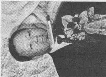
↑教育部杜正勝部長於揭幕記者會上致詞

在校區及理想的組織架構尚未規劃完成前，現有之架構仍然持續運作，而整併後的體育大學架構，將依照體育大學設立目標，以「一般行政組織」、「教學機構」、「學術研究」、「競技訓練」以及「運動科學應用」等作為體育大學發展功能之導向，並由二校協議規劃，共同打造以體育專業為主軸之綜合性大學。